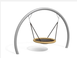
SC.153.3.I Le nid d'oiseau lunaire inox