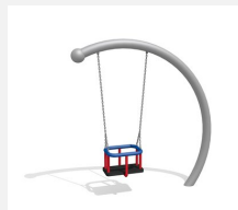
SC.150.I Balançoire demi-lune (pour les petits) inox