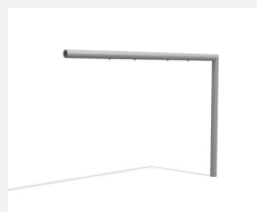
SC.160.09.1 Élément supplém. (fixation exclue) inox