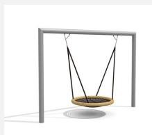
SC.162.3.1 Nid d'oiseau rectangle inox