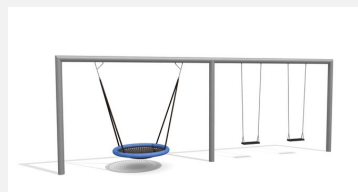
SC.162.32 Combiné balançoire rectangle - nid d'oiseau