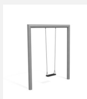
SC.160.1 Balançoire rectangle 1 place