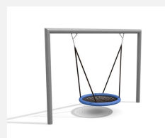
SC.162.3 Nid d'oiseau rectangle