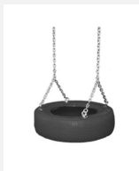
SC.Z10.5 Siège-pneu avec chaînes