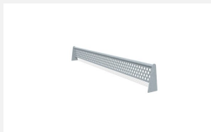
SP.010.09 Filet métallique jusqu'à 7.5 cm