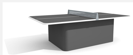
SP.011.13.A Table de ping-pong arrondie box anthracite