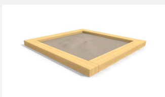
SW.012.25.H Bac à sable standard 2.5 x 2.5 m - style