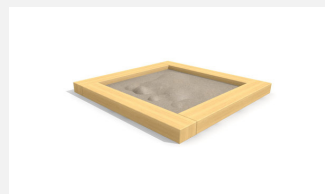
SW.012.20.H Bac à sable standard 2.0 x 2.0 m - style