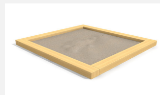
SW.012.30.H Bac à sable standard 3.0 x 3.0 m - style