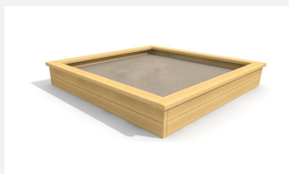
SW.014.25 Bac à sable haut 2.5 x 2.5 m