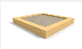
SW.014.25.H Bac à sable haut 2.5 x 2.5 m en bois dur