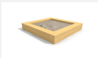
SW.014.20.H Bac à sable haut 2.0 x 2.0 m en bois dur