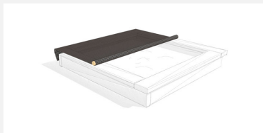
SW.030.15 Bâche noire avec barre d'enroul. pour 1.5 x 1.5 m