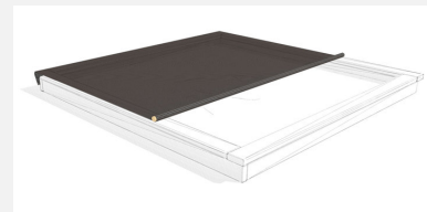
SW.030.30 Bâche noire avec barre d'enroul. pour 3 x 3 m