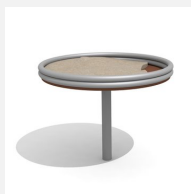
SW.041.1 Table de jeux de sable en métal