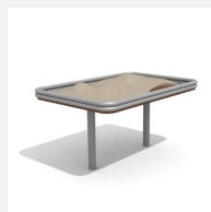
SW.041.2 Table de jeux de sable