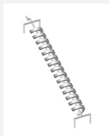
SW.141.3 Spirale d'eau ouverte 300