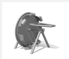
SW.145.1 Roue à puiser