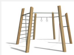
TF.7020.R Multigym nature