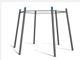
TF.7022 Somersault High TRX