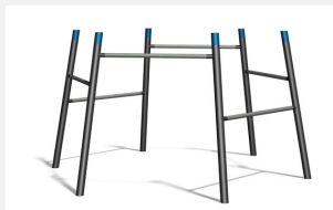
TF.7021 Somersault 6