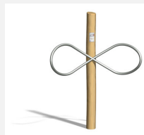
UF.6084.R Ying Yang nature