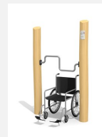
UF.6153.R Handbike Handicap