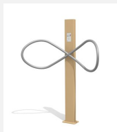
UF.6084 Ying Yang