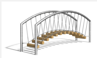
BA.057.1 Passerelle 1 de bimbo - steel