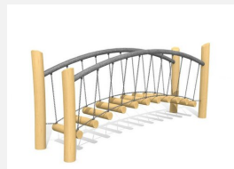
BA.057.1.R Passerelle 1 de bimbo - nature