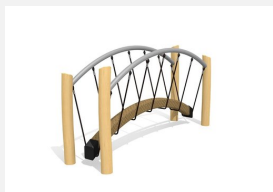
VP.068.R Le pont de cordes de bimbo - nature