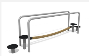
VP.064 Pont de cordes d'équilibre - steel