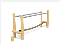
VP.064.R Pont de cordes d'équilibre - nature