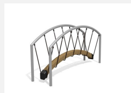
VP.068 Le pont de cordes de bimbo - steel