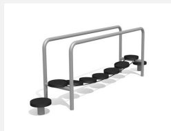
VP.062 Le pont chancelant de bimbo steel