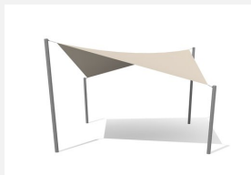
WS.010.5 Voile-parasol 5 x 5 m