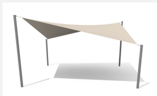
WS.010.6 Voile-parasol 6 x 6 m