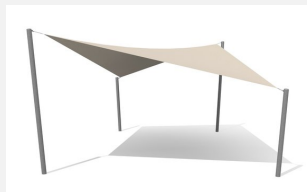
WS.010.9 Voile-parasol sur mesure