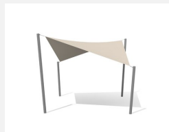
WS.010.4 Voile-parasol 4 x 4 m