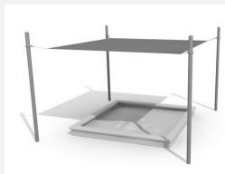
WS.012.30 Bâche combinée 300 x 300 cm