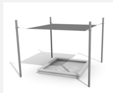
WS.012.25 Bâche combinée 250 x 250 cm