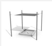
WS.012.20 Bâche combinée 200 x 200 cm