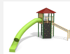
XL.011.L Tour hexagonale XL 011 toboggan, lasure en