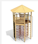
XL.010 Tour hexagonale XL