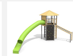
XL.011.M Tour hexagonale XL 011 toboggan virage