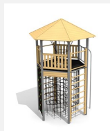
XL.010.M Tour hexagonale XL