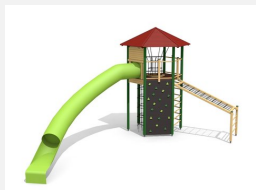
XL.011.L Tour hexagonale XL 011 toboggan, lasure en