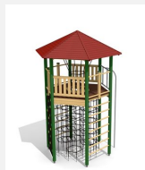
XL.010.L Tour hexagonale XL