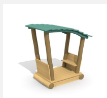
XL.3.01.02.L Remorque avec toit - lasuré