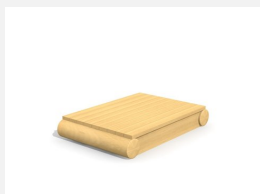
XL.3.01.04 Remorque plateforme