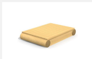
XL.3.01.04.L Remorque plateforme - lasuré