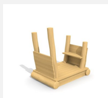
XL.3.01.03 Remorque sans toit