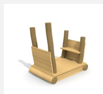
XL.3.01.03.L Remorque sans toit - lasuré