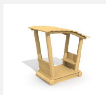
XL.3.01.02 Remorque avec toit