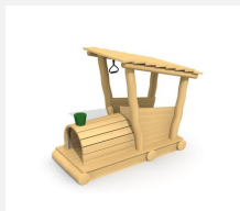
XL.3.01.01 Jim's Locomotive en bois de robinier