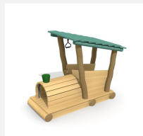
XL.3.01.01.L Jim's Locomotive en bois de robinier -