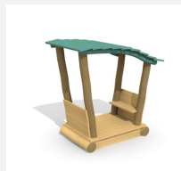
XL.3.01.02.L Remorque avec toit - lasuré