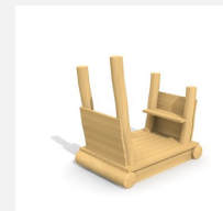
XL.3.01.03 Remorque sans toit