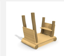
XL.3.01.03.L Remorque sans toit - lasuré