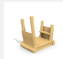
XL.3.01.03 Remorque sans toit