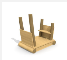
XL.3.01.03.L Remorque sans toit - lasuré