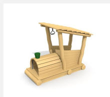
XL.3.01.01 Jim's Locomotive en bois de robinier