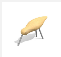
SOPR.001 Le moineau - Bonne affaire