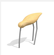
SOPR.002 La cigogne - Bonne affaire