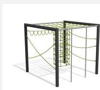
KL.160.1.25 Cube de grimpe en métal 1, hauteur 250