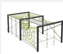
KL.160.2.20 Cube de grimpe en métal 2, hauteur 200