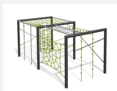
KL.160.2.25 Cube de grimpe en métal 2, hauteur 250 cm