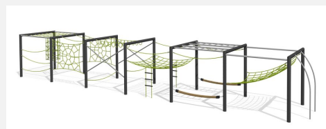
KL.160.6.25 Cube de grimpe en métal 6, hauteur 250 cm