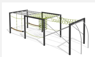
KL.160.4.25 Cube de grimpe en métal 3, hauteur 250 cm