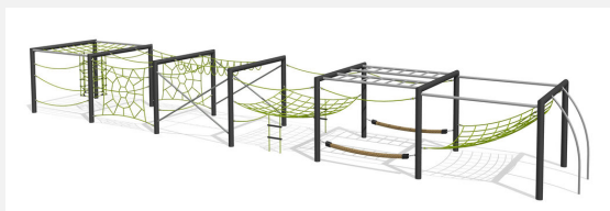
KL.160.6.20 Cube de grimpe en métal 6, hauteur 200 cm