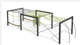
KL.160.4.20 Cube de grimpe en métal 3, hauteur 200 cm