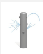
SW.135.3 Jet d'eau 3 avec buse à