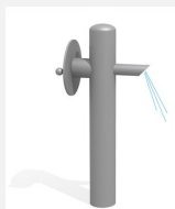
SW.134.1 Pompe rotative 2