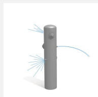
SW.135.2 Wasserspielsäule 2