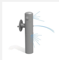
SW.135.1 Jet d'eau 1, avec poignée rotative