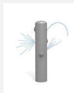
SW.135.3 Jet d'eau 3 avec buse à