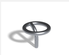
C874 L'anneau 1 droit