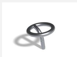
C300 L'anneau 2 incliné