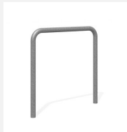
DI.106.18 Appui vélos Tube 85.1