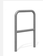
DI.106.25 Appui vélos Tube 55.2