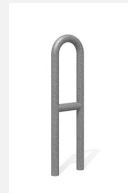
DI.106.22 Appui vélos Tube 25.2