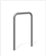
DI.106.15 Appui vélos Tube 55.1