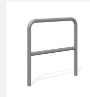
DI.106.28 Appui vélos Tube 85.2