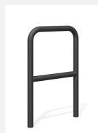
DI.106.25.C Appui vélos Tube 55.2