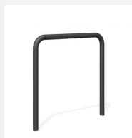
DI.106.18.C Appui vélos Tube 85.1 color