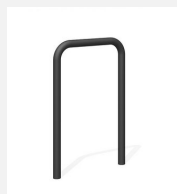
DI.106.15.C Appui vélos Tube 55.1 color