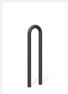
DI.106.12.C Appui vélos Tube 25.1