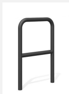
DI.106.25.C Appui vélos Tube 55.2