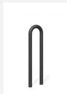
DI.106.12.C Appui vélos Tube 25.1