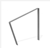
DI.108.19 Appui vélos Areo 95.1