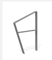
DI.108.26 Appui vélos Areo 65.2