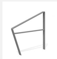
DI.108.29 Appui vélos Areo 95.2