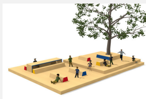
SL.050.90.C Le podium