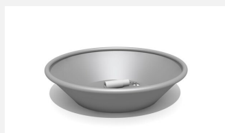
SW.141.20 Bassin rond en forme de cône, sans support