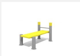
SWC.4119 Bench Sit Up 119