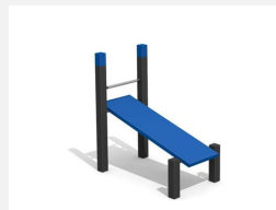
SWC.4113 Banc incliné 113 - Modèle d'exposition à