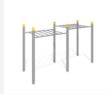
SWC.4252 Monkey bars 252