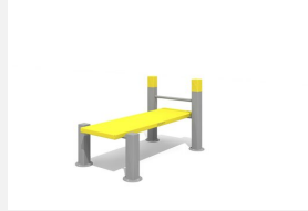
SWC.4119 Bench Sit Up 119