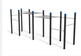
SWC.4253 Streetworkout 253