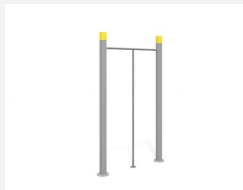
SWC.4009 Dance Pole 009