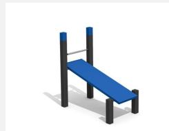
SWC.4113 Banc incliné 113 - Modèle d'exposition à