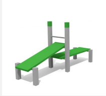
SWC.4115 Double bench 115