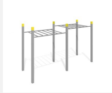
SWC.4252 Monkey bars 252