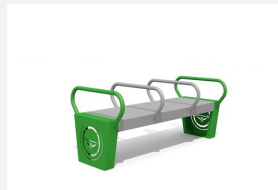
SWC.4101 Dip bench 3