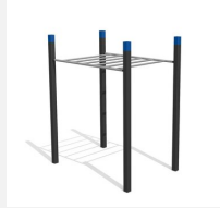
SWC.4251 Monkey bars 251