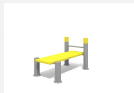
SWC.4119 Planche Abdo 119