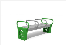
SWC.4101 Dip bench 3