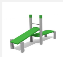
SWC.4115 Double bench 115