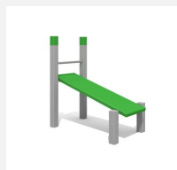
SWC.4113 Banc incliné 113 - Modèle