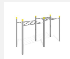
SWC.4252 Echelle de singe 252