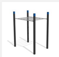
SWC.4251 Monkey bars 251