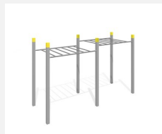
SOPR.006 Echelle de singe 252 - Bonne affaire