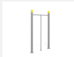
SWC.4009 Dance Pole 009