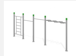
SWC.4461 Streetworkout 461