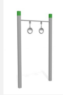
SWC.4465 Anneaux 465