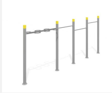
SWC.4462 Streetworkout 462