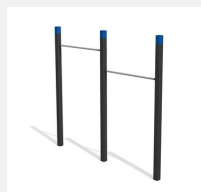
SWC.4452 Pull Up bars 452