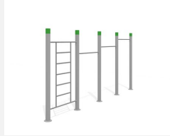
SWC.4463 Streetworkout 463