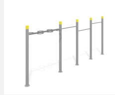
SWC.4462 Streetworkout 462