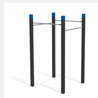
SWC.4455 Pull Up bars 455