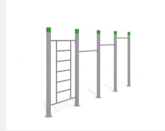
SWC.4463 Streetworkout 463