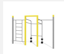
SWC.4459 Streetworkout 459