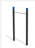
SWC.4451 Pull Up bars 451