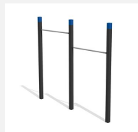
SWC.4452 Pull Up bars 452