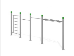
SWC.4461 Streetworkout 461