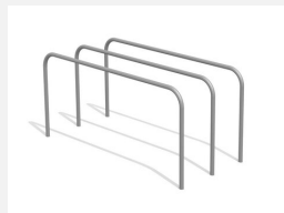
SWC.4355 Parallel Bars 355